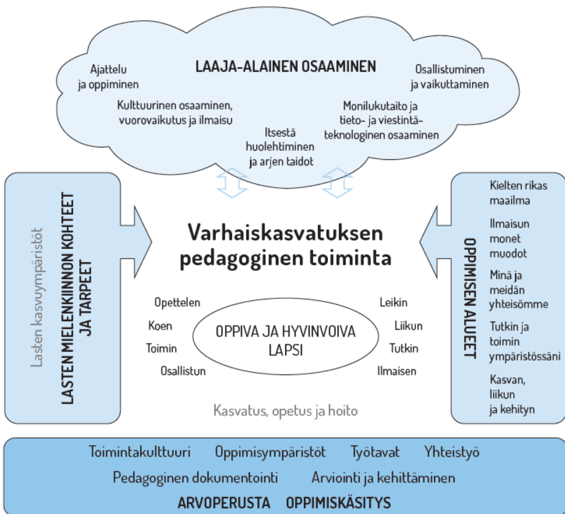
Kuvio 1. Varhaiskasvatuksen pedagogisen toiminnan viitekehys

Pedagoginen toiminta tapahtuu vuorovaikutuksessa varhaiskasvatuksen henkilökunnan sekä lasten kanssa ja sen tavoitteena on edistää lapsen oppimista, hyvinvointia sekä laaja-alaista osaamista. Lasten omaehtoinen, henkilöstön ja lasten yhdessä ideoima sekä henkilöstön suunnittelema toiminta täydentävät toisiaan. Tavoitteellisen toiminnan perustana ovat arvoperusta, oppimiskäsitys, toimintakulttuuri, monipuoliset oppimisympäristöt, yhteistyö sekä monipuoliset työtavat. Laadukkaan pedagogisen toiminnan edellytyksenä on suunnitelmallinen dokumentointi, arviointi ja kehittäminen. Valtakunnallisessa varhaiskasvatussuunnitelman perusteet 2016 -asiakirjassa kuvataan seuraavan kuvion 1 avulla kuinka varhaiskasvatuksen pedagoginen toiminta läpäisee kasvatuksen, opetuksen ja hoidon kokonaisuuden (Opetushallitus, Varhaiskasvatussuunnitelman perusteet 2016, s. 36):