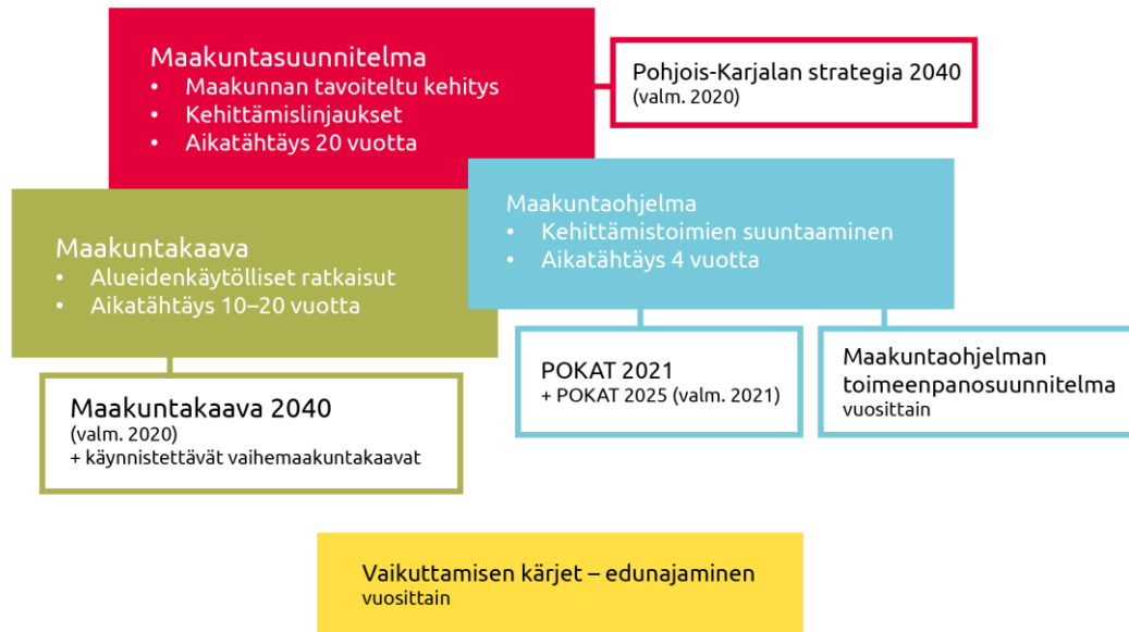
Kuva 2 Maakunnan suunnittelujärjestelmä.